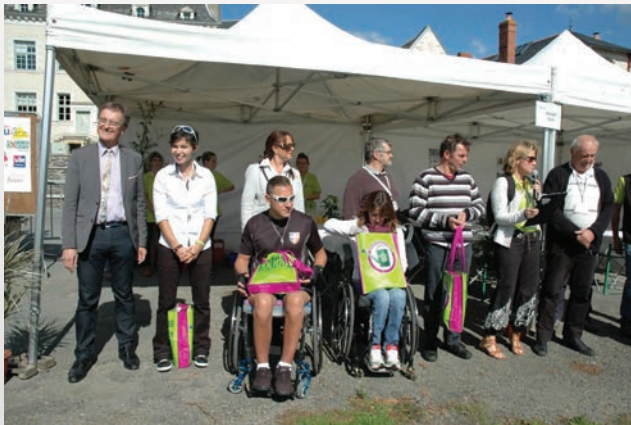
Podium accessible nécessitant un accompagnement

Les compétiteurs Paracanoë font souvent peu de courses durant l'année. Chaque remise de récompense est un moment important de la compétition et participe à l'image positive de la discipline.