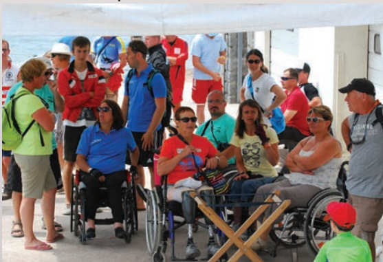
Zone d'attente abritée avant la remise des médailles

Il est important de réfléchir au cheminement entre les différentes zones de la cérémonie protocolaire et de bien définir ces zones (accueil, attente, podium, attente après le podium). Il faut aussi penser à bien donner le lieu de rendez-vous et l'heure précise (l'adaptation sera plus difficile pour une personne en situation de handicap s'il faut rejoindre un nouveau point de ralliement dans une foule. La vision basse d'une personne en fauteuil implique qu'elle se repère plus difficilement, ...). Le point de ralliement ou la zone d'attente avant les podiums doivent être équipés de bancs ou de sièges pour l'attente des personnes dont la station debout est pénible.