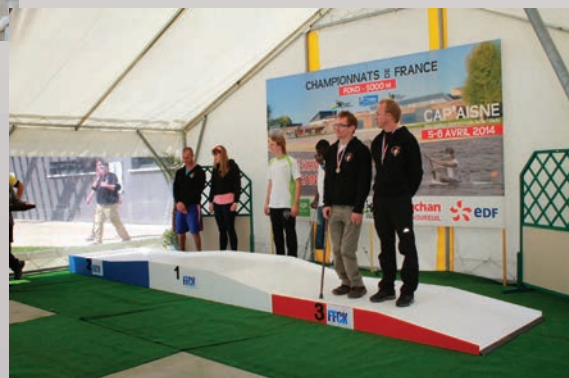
Podium accessible réalisé par un lycée professionnel