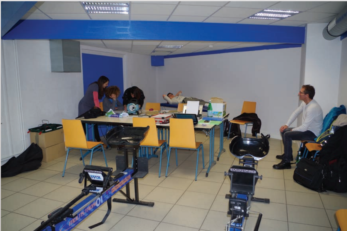
Salle de réunion aménagée pour les classifications

La classification se déroule généralement la veille des compétitions Paracanoë. Elle permet également de donner les dernières informations aux responsables des programmes de course pour finaliser les listes de départ.