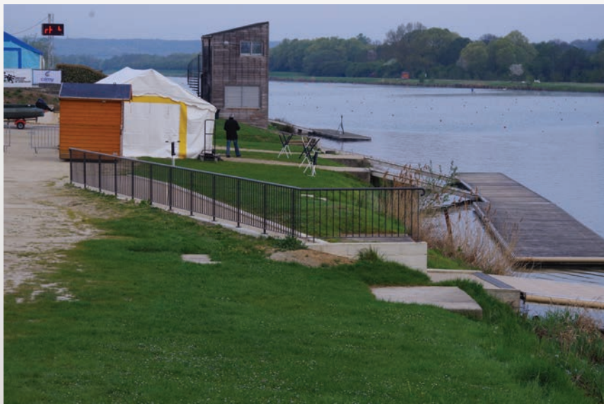
Une tente parasol située à côté de l'espace accessible d'embarquement. Les places de parking sont réservées devant la tente.

L'ensemble des espaces publics (buvette, stands d'animation ou de vente, ...) doit être accessible.