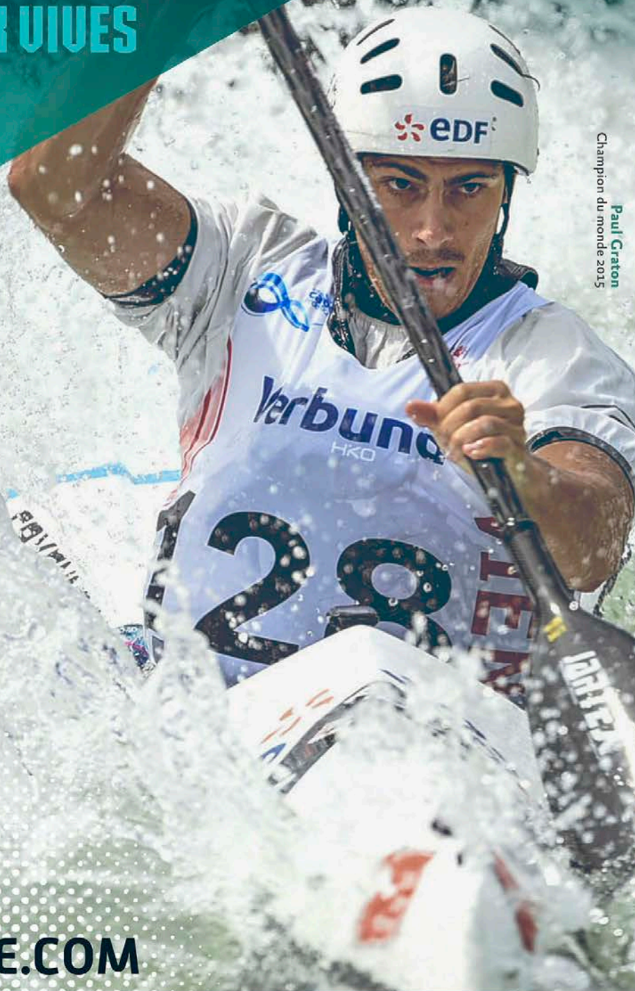
Paul Graton Champion du monde 2015